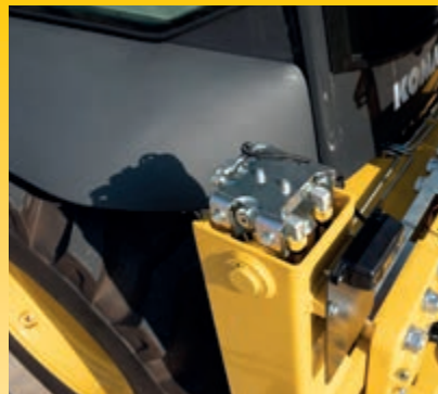
Clapets de sécurité pour les stabilisateurs, la flèche et le balancier (de série)