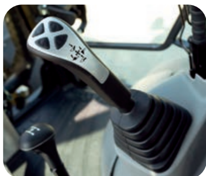
Manipulateur avec commandes précises, pratiques et ergonomiques

Le moniteur LCD haute définition de 7" offre une visibilité exceptionnelle. Il est très facile à lire et est moins affecté par l'angle de vue ou les conditions d'éclairage. Il affiche divers avertissements et des informations sur la machine dans un format simple. D'autres informations utiles comme les rapports d'opération, les paramètres de la machine et les données relatives à la maintenance sont également affichées. L'opérateur peut naviguer aisément entre les affichages grâce aux boutons latéraux.