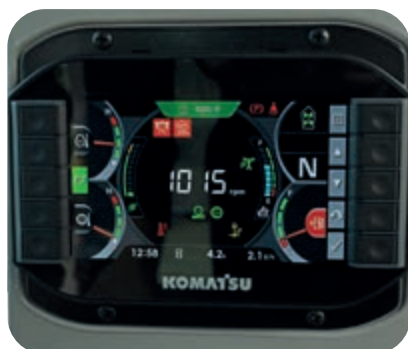
Écran multi-fonctions de 7"